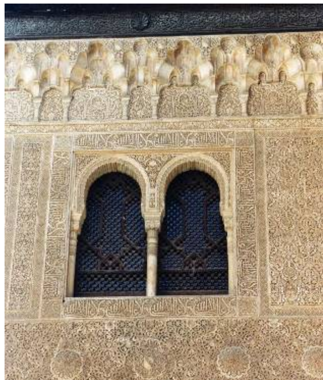
Alhambra, 2002