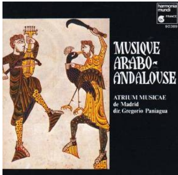
Illustration : Reproduction avec l'autorisation de la British Library, Additional Ms. 11695 f.86

Pour en savoir plus sur le distributeur : http://www.harmoniamundi.com/home_flash.php